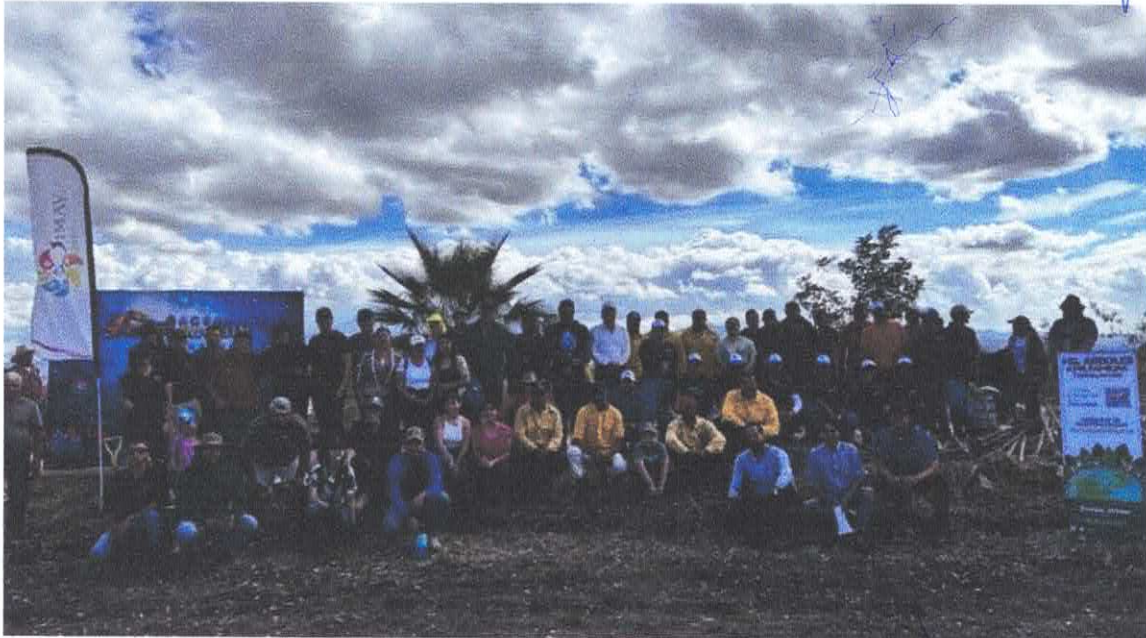
Reforestación de las Vías Verdes en los Municipios Teuchitlán y Ahualulco de Mercado

Periodo reportado: 01 de julio al 30 de septiembre